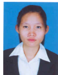
HOK, Siem Phnom Penh (URDE, Droit) Fonds Spécial, CAHRAD