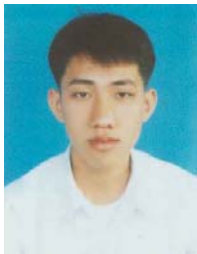
BOU, Monorom Kampong Cham (ITC, Ingénieur Electr.)