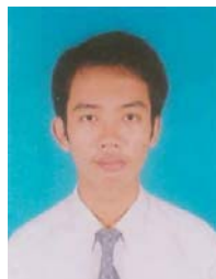
VALY, Dona Battambang (ITC, Informatique) Fonds Général, CEEF