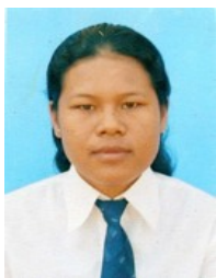
EAV, Saran Takeo (ITC, Chimie) Fonds Spécial, Tan Chip