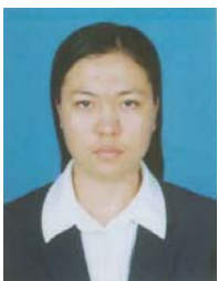
HAK, Danet Kratie (ITC, Chimie/Agro-alimentaire) Fonds Spécial, CBS