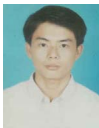
LY, Vuthy Phnom Penh (ITC, Informatique TP) Fonds Spécial, CBS