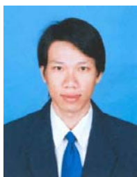
LIV, Yi Battambang (ITC, Mécanique) Fonds Spécial, CBS