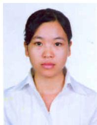
RY, Thida Battambang (URDE, Droit) Fds Spécial, CAHRAD