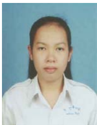
ROS, Hemvila Battambang (ITC, Ingénieur Agric.) Fonds Général, CEEF