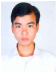
BUOY, Piseth Kandal (URPP, Informatique) Fonds Spécial, FLS