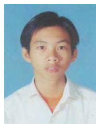
OUK, Mithona Kampong Chhnaing (ITC, Informatique) Fonds Général, CEEF