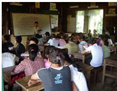
Classe de l'anglais au Lycée Ek Phnom

Un projet pilote d'une année a été créé en partenariat avec le "Khmer Center for Development" (KCD). La FCEE fournira une assistance financière à 50 étudiants afin de leur permettre de suivre des cours d'anglais au lycée Ek Phnom, dans la province de Battambang. Le programme sera administré par le KCD pendant une année. Le renouvellement de l'assistance financière par la FCEE sera déterminé en fonction du succès et la viabilité du programme.