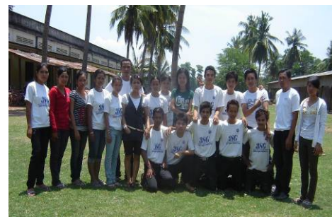
Les membres de "Students Support Students Group (3SG)"

Le 28 avril dernier, la FCEE a signé un protocole d'accord avec le lycée Ek Phnom dans la province de Battambang, afin de fournir 20 bourses d'études (montant total de 4000 dollars) aux élèves de dernière année de lycée qualifiés, afin de poursuivre des études à l'université de leur choix. Ces étudiants devront obtenir leur diplôme de fin d'études de lycée Ek Phnom en 2008, et devront également répondre aux critères de sélection tels que définis par la FCEE. En partenariat avec le "Khmer Center for Development" (KCD), celui-ci a accepté de faciliter le processus de dépôt de candidature ainsi que le déboursement des fonds relatifs aux bourses. Le KCD et son groupe affilié d'étudiants -- le "Students Support Students Group" (3SG) -- serviront de représentants et d'éléments motivateurs pour tous les autres candidats potentiels aux bourses. Pour plus d'information, veuillez cliquer