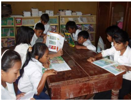
Une bibliothèque scolaire à Banteay Meanchey

Le 6 juin dernier, la FCEE a signé un protocole d'accord avec l'école primaire Phum Svay, dans la province de Banteay Meanchey, ainsi qu'avec une ONG cambodgienne, la "Khmer Buddhist Association" (KBA), dans le but de créer une bibliothèque au sein de la dite école. La bibliothèque sera dédiée à tous les jeunes enfants de la campagne, afin de leur permettre d'accéder à la connaissance et de s'enrichir intellectuellement. La FCEE fournira les fonds nécessaires à la KBA pour l'achat, en 2008, d'un bureau, de tables, de chaises, d'étagères et de livres. Tous les autres frais encourus durant la création de la bibliothèque seront partagés à charge égale entre la FCEE et le KBA. La fondation financera annuellement le remplacement de livres, et ce jusqu'en 2015. A partir de 2016, ce sera l'école primaire de Phum Svay et le KBA qui assureront entièrement la responsabilité financière relative au fonctionnement et à l'entretien de la bibliothèque. Lire la lettre ouverte du Président de la FCEE en page 8. Pour plus d'information, veuillez cliquer ici .